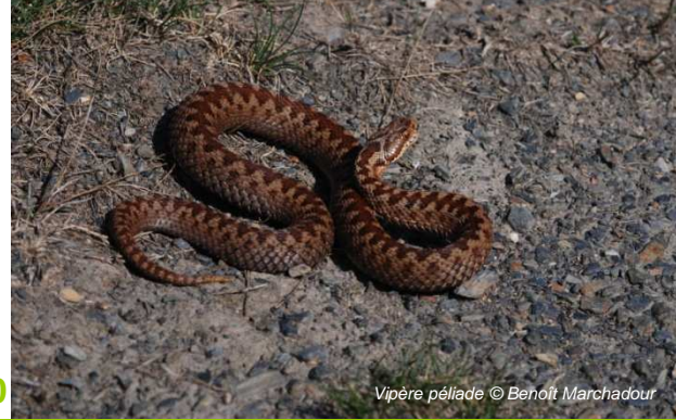
Vipère péliade

Samedi 20 et Dimanche 21 novembre 2010 À Liré (49) Inscription obligatoire avant le 10/11/2010