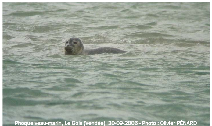
Phoque veau-marin, Le Gois (Vendée), 30-09-2006

Cette espèce, qui fréquente l'Atlantique nord, est principalement connue à l'est du Cotentin, en particulier dans la baie de Somme. Les observations sur la façade atlantique sont relativement rares.