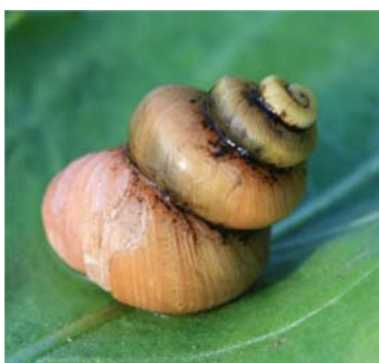
Forme sub-scalaire de l'escargot terrestre Cepaea nemoralis