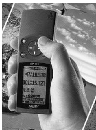
Le GPS SP 12X de la marque MLR : un appareil bien adapté au travail de terrain. Il effectue les mesures en grades, en degrés, en UTM et peut les convertir. Avec 600 points mémorisables et une aide en ligne, il présente un excellent rapport qualité/prix.

Prix spécialement étudié pour les Naturalistes Vendéens (sur présentation de la carte de membre) chez MASSON S.A. Quai de la Cabaude 85100 Les Sables d'Olonne (demander M. CHEVILLON au 02 51 32 01 07 ou 06 11 35 92 19).