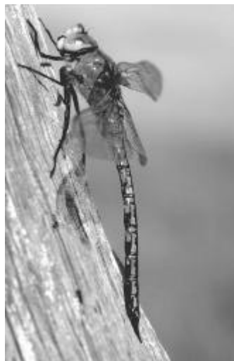
L'Anax empereur X, Anax imperator , avec son thorax vert et son abdomen bleu tacheté de noir, est l'une des plus grandes libellules de Vendée.

Adresse : 176 cité de la Garenne Bat. D 85000 LA ROCHE-SUR-YON Tél. : 02 51 37 99 16 (le soir)