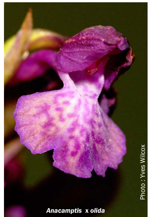
Anacamptis x olida