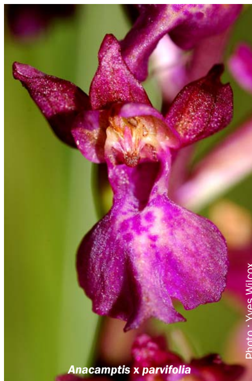
Anacamptis x parvifolia