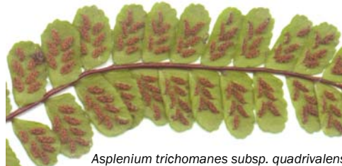
Asplenium trichomanes subsp. quadrivalens

Le début de l'automne est la bonne période pour observer les fougères. Plantes sans fleur souvent méconnues et négligées des botanistes débutants, oubliées par les ouvrages destinés au grand public, elles sont pourtant très intéressantes.