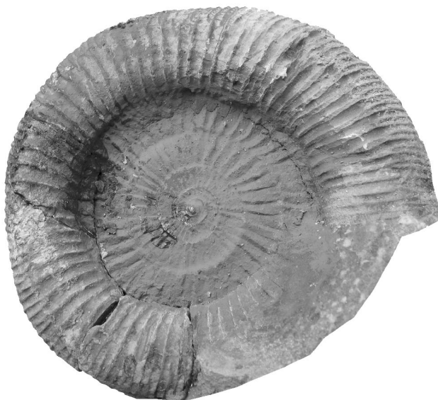
Dactylioceras (Eodactylites) mirabile Fucini