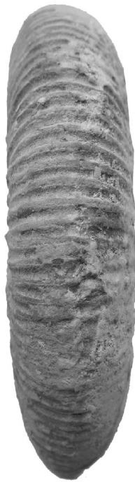
Dactylioceras (Eodactylites) polymorphum Fucini