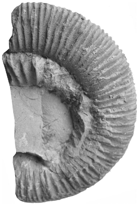
Dactylioceras (Eodactylites) mirabile Fucini