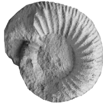
Dactylioceras (Eodactylites) simplex Fucini