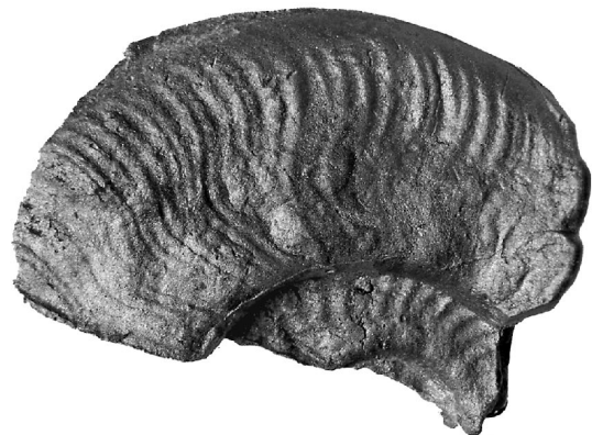
Lioceratoides serotinus Bettoni