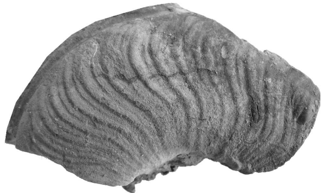
Protogrammoceras (Paltarpites) paltum (Buckman)