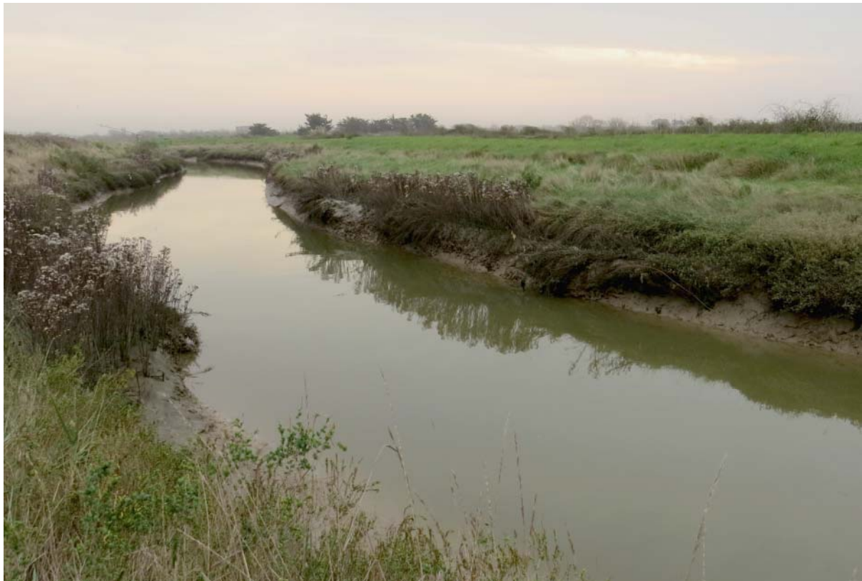
Fig. 2 – Le chenal du ruisseau de l'Île Bernard dans les marais de Talmont sur le site de capture des juvéniles d'Alose feinte